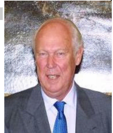
VITTORIO EMANUELE CAPO DI CASA SAVOIA